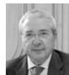
Jean-Paul Huchon, président du conseil régional d’Ile-de-France

L’Ile-de-France se dote d’un lieu dont la vocation est d’être le point de rencontre des acteurs du Web2.0 français.”