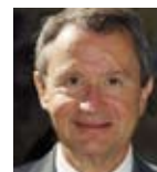
Michel Moynier, maire de Narbonne

En matière de développement durable, on se doit d'agir localement, car l'avenir de nos enfants nous engage en changeant d'habitudes et d'attitudes.”